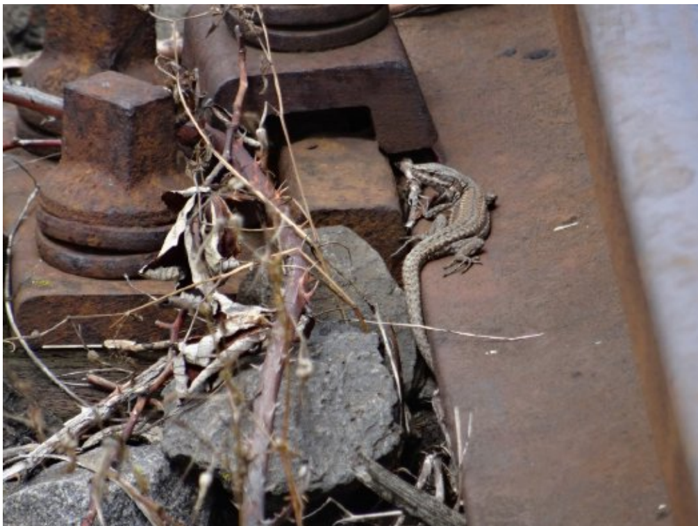
Abb. 5: Männliche Mauereidechse auf einem alten Gleis.

Für das Vorkommen am Gernsheimer Bahnhofsgelände gilt dasselbe, wie für die anderen Probeflächen: Für eine gesicherte Einstufung wäre es notwendig, die aktuelle flächige Ausdehnung der Population zu ermitteln.