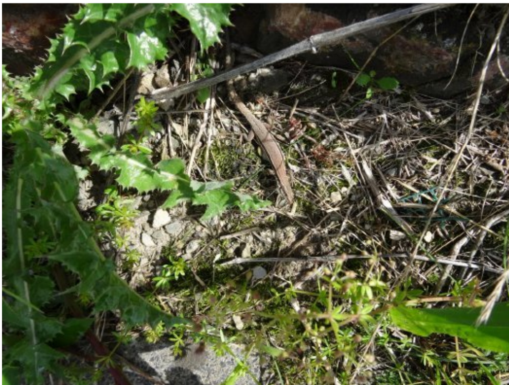
Abb. 8: Juvenile Mauereidechse am Mauerfuß.

Eine Abgrenzung einzelner Populationen oder Vorkommensbereiche im Gebiet steht weiter hin aus.