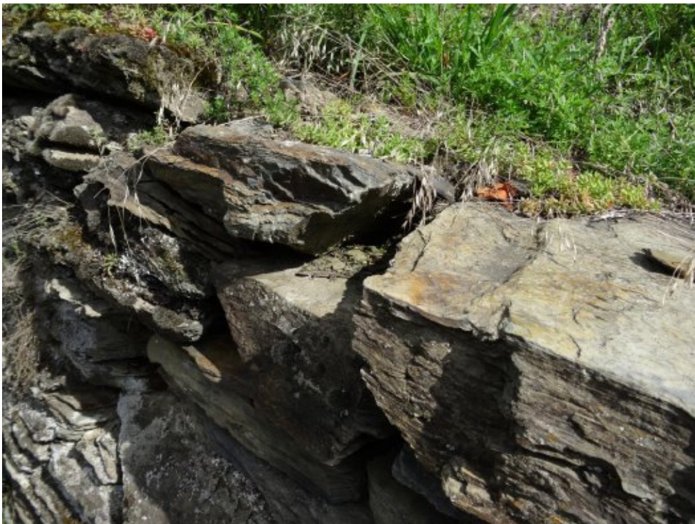
Abb. 7: Eine der wenigen Mauereidechsenbeobachtungen am Transekt auf einer Trockenmauer.

Im Gebiet sind keine Beeinträchtigungen zu erkennen. Freistellungsarbeiten und eine dauerhafte Pflege haben die besiedelbare Fläche in den letzten Jahren sogar stark vergrößert. Es ergibt sich A.