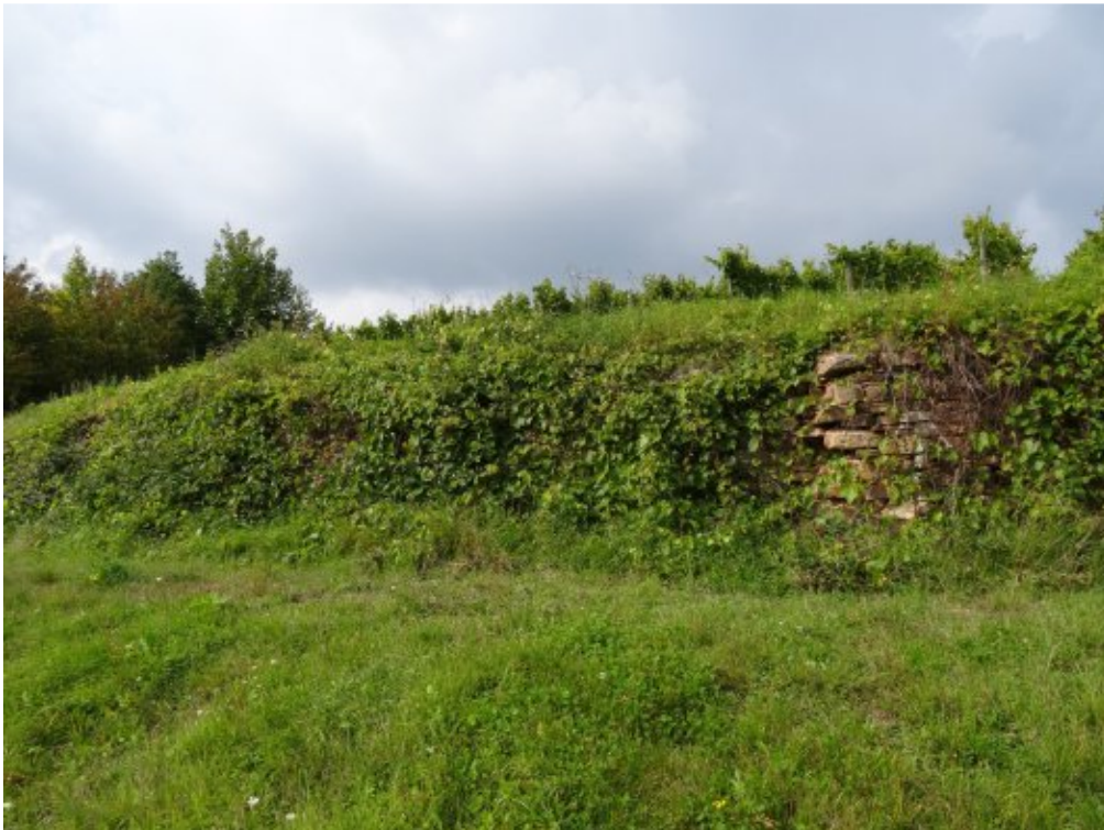
Abb. 9: Zunehmende Verbuschung einzelner Trockenmauerabschnitte am Transekt Oestrich-Winkel, Dachsberg.

Beeinträchtigungen sind nicht zu erkennen. Der Lebensraum wurde im Gegenteil in den letzten Jahren kontinuierlich durch die schrittweise Sanierung von Trockenmauern aufgewertet. Die Bedeckung der vertikalen Strukturen hat sich im Vergleich zum Vorjahr erhöht, liegt aber immer noch nicht über 25%. Es folgt für den Parameter die Einstufung A.