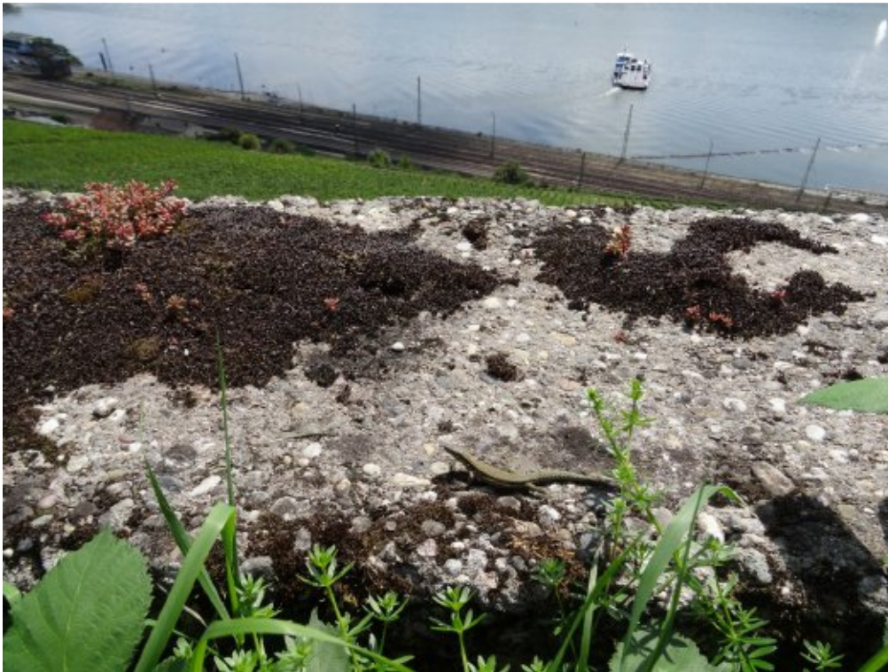
Abb. 4: Weibliche Mauereidechse auf einer Betonmauer.

Die Ausdehnung der Mauereidechsenpopulationen in und um Rüdesheim ist weiterhin nicht bekannt.