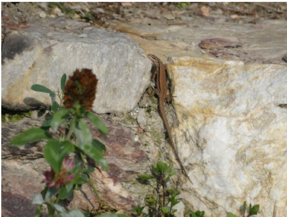
Abb. 2: Weibchen der Mauereidechsen im Gebiet Rüdesheim, Kronnest.

Als Grundlage des Monitorings liegen die landesweiten Artgutachten von FUHRMANN (2003), die Gutachten zum ersten und zweiten Bundes- bzw. Landesmonitoring in Hessen (ZITZMANN & MALTEN 2009, 2011a, 2011b), sowie das erste Gutachten für den EU-Bericht 2019 (ZITZMANN & MALTEN 2016) vor. Weiterhin wurde die aktuelle vom HLNUG-Abteilung Naturschutz geführte Natis-Datensammlung zur Verfügung gestellt.