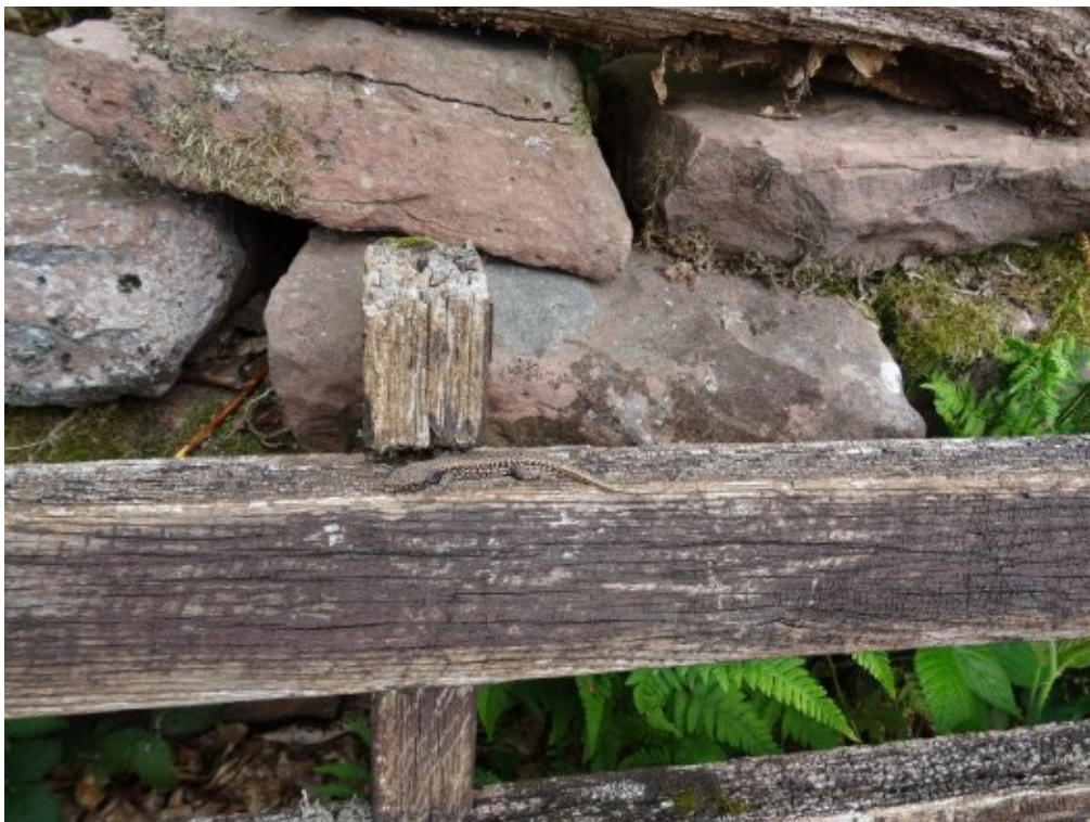
Abb. 6: Männchen der Mauereidechse auf einer Bank neben dem Steinbruch.

Vor Beginn der Kartiersaison 2017 war das Gebiet bereits großflächig gerodet worden. Im Laufe der Saison wucherte der Transekt beinahe vollständig zu. Im Gesamtgebiet entstanden aber ausgedehnte Freiflächen, die von der Mauereidechse besiedelt werden konnten. Anders als in 2016, als die Rodungsarbeiten während der Aktivitätsperiode der Mauereidechse stattfanden, gab es diese Beeinträchtigungen in 2017 nicht.