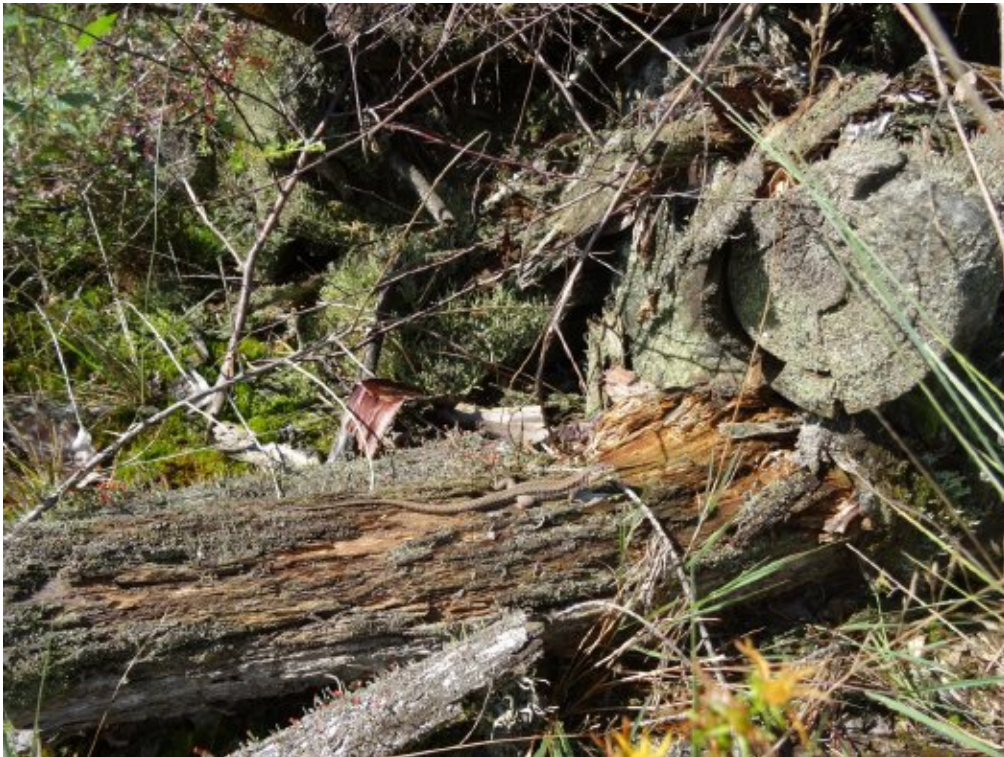
Abb. 3: Mauereidechsen-Männchen auf Totholz.

Die gesamte Größe der Population und die Ausdehnung auf der Fläche sind weiterhin nicht bekannt.